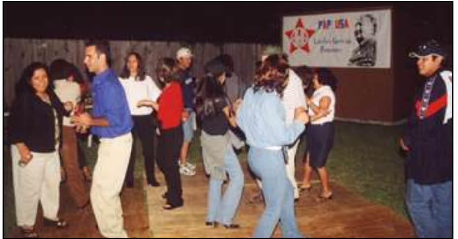
La fiesta continuó hasta la madrugada bajo la atenta mirada de Víctor Raúl Haya de la Torre.