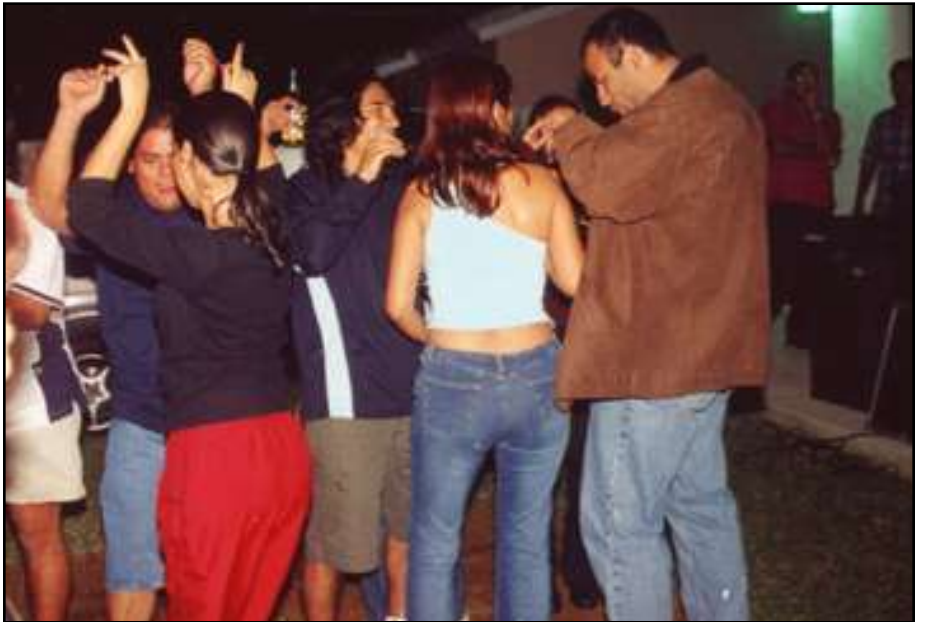
Definitivamente la juventud tiene los requisitos para conducir el futuro de nuestra nación.